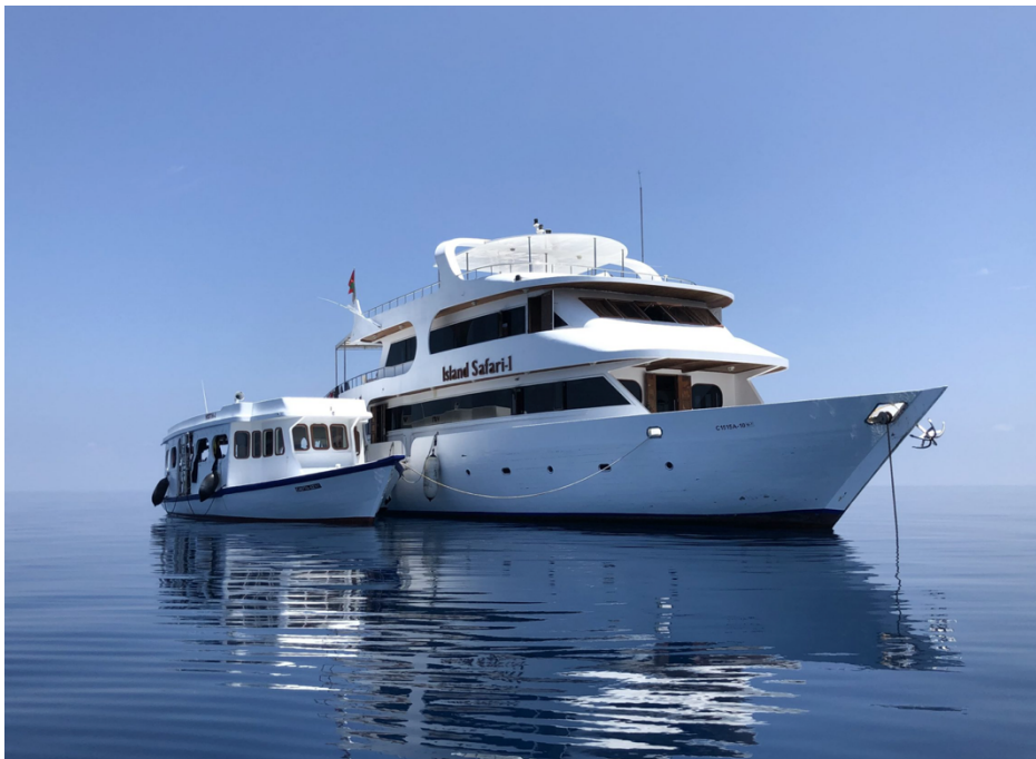
Island safari 1